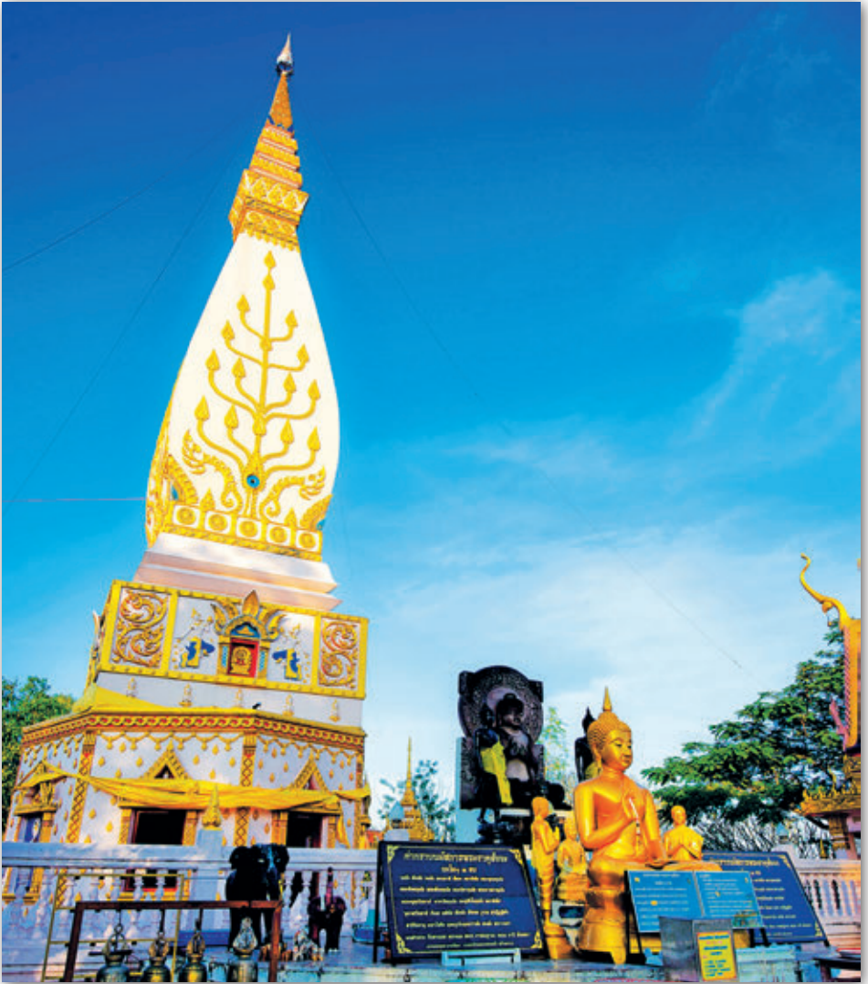
พระธาตุสี่จั่ว

โคลนลงมาในอดีต และให้เป็นปูชนียสถานอันเป็นที่ เคารพสักการะบูชาต่อไป