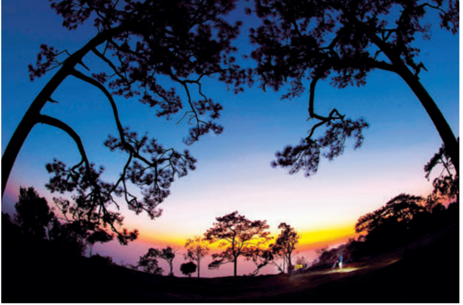
อุทยานแห่งชาติภูกระดึง

ควรสำรวจสุขภาพความพร้อมของร่างกายก่อนเดินทาง เพราะต้องใช้เวลาเดินและปั่นจักรยานที่มีระยะทางรวม ๙ กิโลเมตร (ขึ้นเขา ๕ กิโลเมตร ทางราบอีกประมาณ ๓-๔ กิโลเมตร) อุทยานฯ เปิดให้นักท่องเที่ยวเดินขึ้นภูกระดึง ตั้งแต่เวลา ๐๗.๐๐-๑๔.๐๐ น. และอุทยานฯ จะปิดเพื่อฟื้นฟูสภาพป่าระหว่างเดือนมิถุนายน-กันยายน ของทุกปี เส้นทางขึ้นภูกระดึง ทางขึ้นค่อนข้างชัน แต่จะมีจุดแวะพักที่ “ซำ” หมายถึง บริเวณที่มีแหล่งน้ำใต้ดินผุดขึ้นมา แต่ละจุดมีเครื่องดื่มและอาหารบริการ