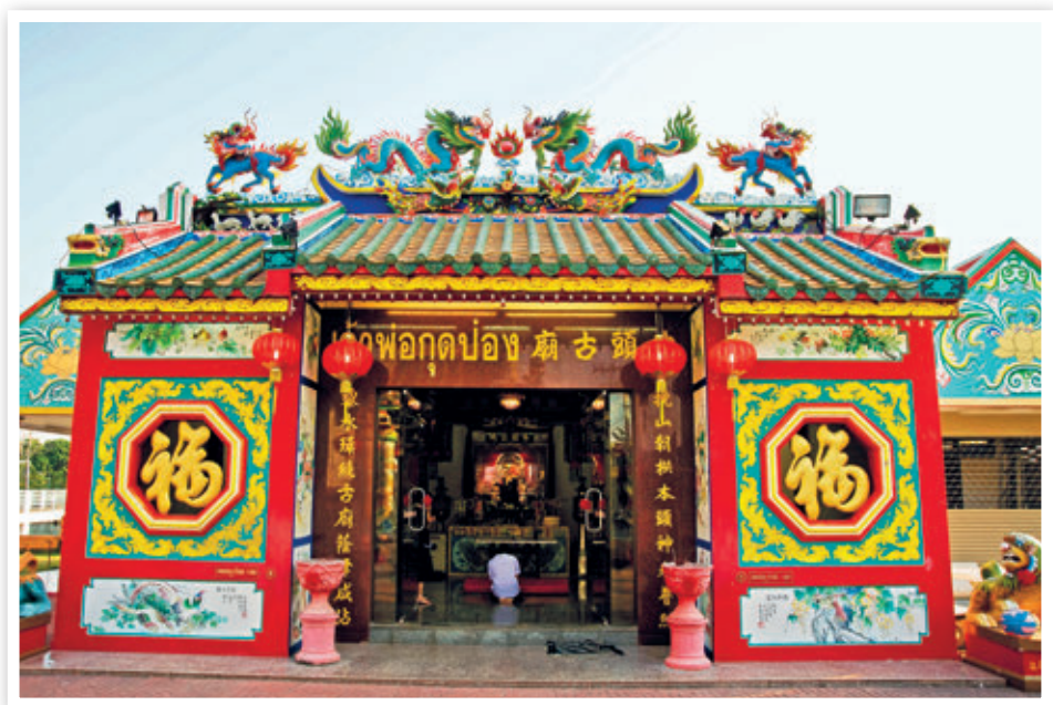
ศาลเจ้าพ่อกุดบ่องและศาลหลักเมือง

ประทับ สภาวัฒนธรรมจังหวัดเลย อัญเชิญมาเก็บรักษาไว้ที่มุขแรกชั้นบนของอาคาร โดยอาคารหลังนี้สร้างเสร็จเมื่อ พ.ศ. ๒๔๗๖ และปัจจุบันกรมศิลปากรได้ขึ้นทะเบียนเป็นโบราณสถานเพื่อการอนุรักษ์ (ชั้นบนจัดเป็นพิพิธภัณฑ์เมืองเลย ชั้นล่างเป็นที่ทำการ ททท. สำนักงานเลย)