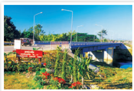
สะพานมิตรภาพน้ำเหืองไทย-ลาว

สะพานมิตรภาพน้ำเหืองไทย-ลาว ตั้งอยู่ที่บ้านนากระเซิง เป็นสะพานข้ามแม่น้ำเหือง เชื่อมระหว่างไทยและสาธารณรัฐประชาธิปไตยประชาชนลาว สะพานนี้สามารถเดินทางผ่านไชยะบุรี สู่มืองมรดกโลก คือหลวงพระบางได้ ระยะทาง ๓๖๓ กิโลเมตร หรือเดินทางข้ามไปท่องเที่ยวและซื้อสินค้าปลอดภาษี บริเวณร้านค้าใกล้สะพานฝั่งสาธารณรัฐประชาธิปไตยประชาชนลาวได้