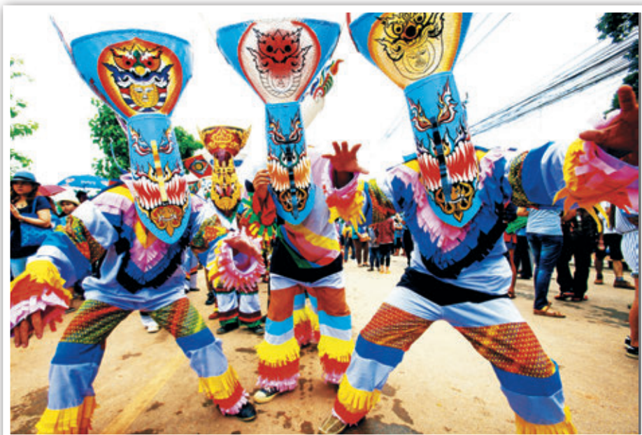
การละเล่นผีตาโขน

และจากคำบอกเล่าของเจ้าพ่อกวน ขณะเข้าทรง เรียกว่า “ผีตามคน” ต่อมาจึงเพี้ยนเป็น “ผีตาโขน” ในที่สุด ลักษณะของผีตาโขน จะแต่งกายด้วยชุดทำจากเศษผ้านำมาเย็บติดกัน มี “หมากกะหล่ง” (ลักษณะคล้ายกระดิ่งใช้แขวนคอกระป๋อง) หรือกระดิ่ง กระพรวน กระบองผูกติดกับบันเอว แขนงคอหรือถือเคาะเขย่าเพื่อให้เกิดจังหวะและมีเสียงดังเวลาเดินแบบขยับตัว สำสละพอก โขยกขา และขยับเอว ผีตาโขนทุกตัวจะมีอาวุธประจำกายเป็นดาบ หรือจ้าวซึ่งทำจากไม้เนื้ออ่อน โดยจะทำให้มีลักษณะคล้ายอวัยวะเพศชายและทาสีแดงตรงปลาย เอาไว้หยอกล้อเพื่อให้เกิดการตื่นเต้นขบขันและสนุกสนาน มิได้ถือเป็นเรื่องลามกหรือหยาบคายแต่อย่างใด ส่วนหัวของหน้ากากผีตาโขน ทำด้วยหวดหนึ่งข้าวเหนียว นำมาหักพับขึ้นให้มีลักษณะคล้ายหมวก ส่วนหน้าทำ