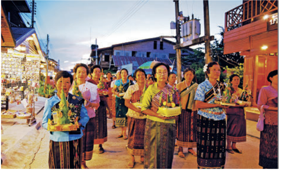
ประเพณีออกพรรษาอำเภอเชียงคาน

งานประเพณีออกพรรษาอำเภอเชียงคาน จัดขึ้นในบริเวณหน้าที่ว่าการอำเภอเชียงคาน ตรงกับวันขึ้น ๑๕ ค่ำ เดือน ๑๑ ของทุกปี เป็นประเพณีที่จัดขึ้นสืบต่อกันมายาวนาน ภายในงานมีขบวนแห่ปราสาทผึ้ง การแข่งขันเรือยาว-เรือกาบ การประกวดไหลเรือไฟ พิธีตักบาตรเทโว การแสดงวัฒนธรรมพื้นบ้านและมหรสพต่าง ๆ