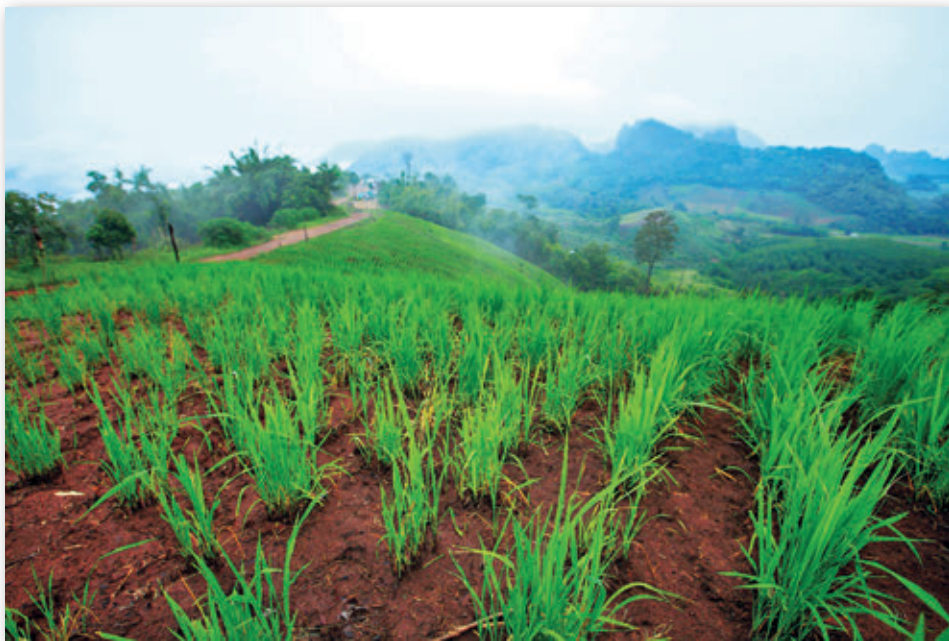
ภูเขาเปาะ

ภูเขาเปาะ ตั้งอยู่ที่บ้านผาห้วย หมู่ ๓ ตำบลปวนพ อำเภอนองหิน จังหวัดเลย ยอดภูเขาเปาะอยู่สูงจากระดับทะเลปานกลาง ๙๑๐ เมตร และห่างจากสวนหินผางาม (คุนหมิงเมืองไทย) ๗ กิโลเมตร เป็นจุดชมวิวที่สามารถมองเห็นภูหอ ที่มีลักษณะเหมือนภูเขาไฟฟูจิที่ญี่ปุ่นได้อย่างชัดเจน นอกจากนี้ยังสามารถมองเห็นทั้งภูกระดึง ภูหลวง ภูयोग ภูผาขวาง ภูค้อ-ภูกระแต สวยหินผางาม ภูผาม่าน นอกจากนี้ยังเป็นจุดชมพระอาทิตย์ขึ้นและพระอาทิตย์ตก และในช่วงฤดูหนาวสามารถมองเห็นทะเลหมอกรอบ ๆ อย่างสวยงาม จึงเหมาะสมที่จะได้ชื่อ “พานอรามาเมืองเลย” ติดต่อ โทร. ๐๘ ๙๗๖๔ ๖๘๒๙