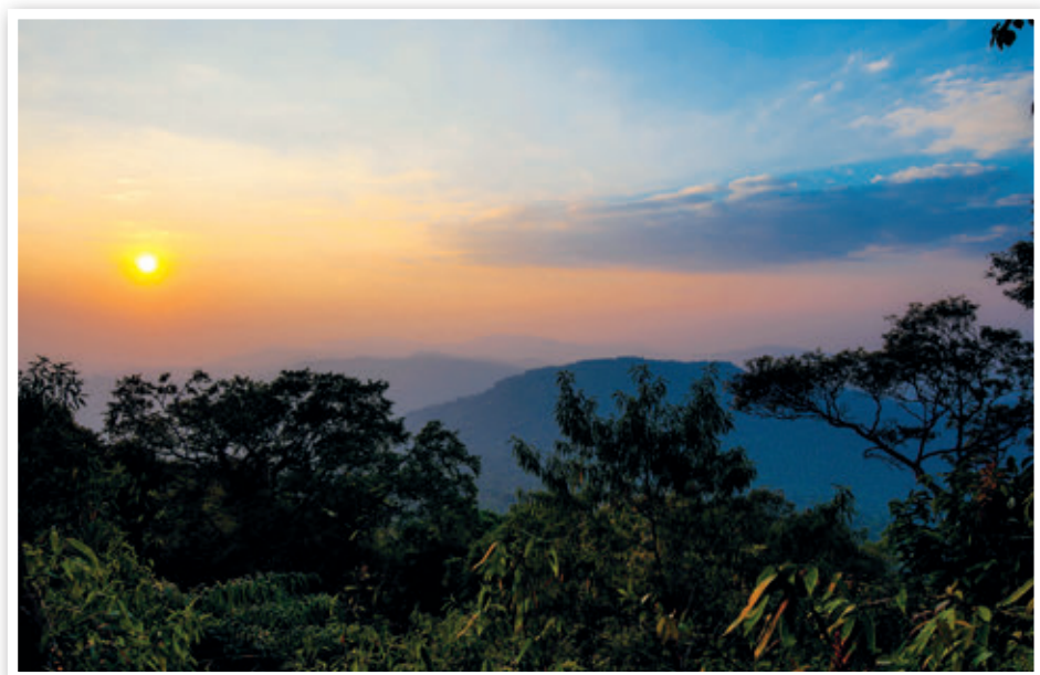
เขตรักษาพันธุ์สัตว์ป่าภูหลวง

การเดินทาง จากอำเภอเมืองเลย ใช้เส้นทางหลวงหมายเลข ๒๐๑ (เลย-วังสะพุง) ถึงทางแยกบ้านห้วยทรายคำ เลี้ยวขวาไปตามเส้นทาง ประมาณ ๗ กิโลเมตร จะเห็นวัดอยู่ด้านขวามือ วัดนี้ หลวงปู่มั่น ฐิริทัตโต เคยนั่งวิปัสสนากรรมฐาน