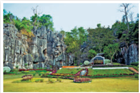
สวนหินผางาม