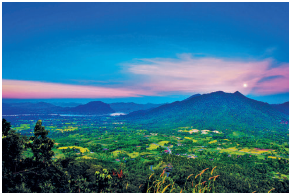
จุดชมวิวภูทอก

บ้านระเบียบโขง ๙๐ ซอย ๔-๕ ตำบลเชียงคาน โทร. ๐ ๔๒๘๒ ๑๗๓๗ จำนวน ๘ ห้อง ราคา ๖๐๐-๑,๒๐๐ บาท