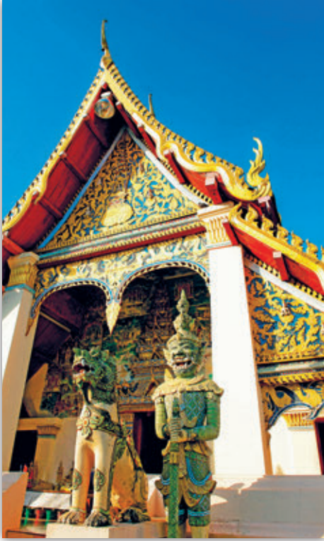
วัดศรีคุณเมือง

บริเวณนี้ และใช้บริการรถสองแถวที่ทาง อบต. เชียงคานจัดไว้บริการ ค่าโดยสารไปกลับคนละ ๒๕ บาท