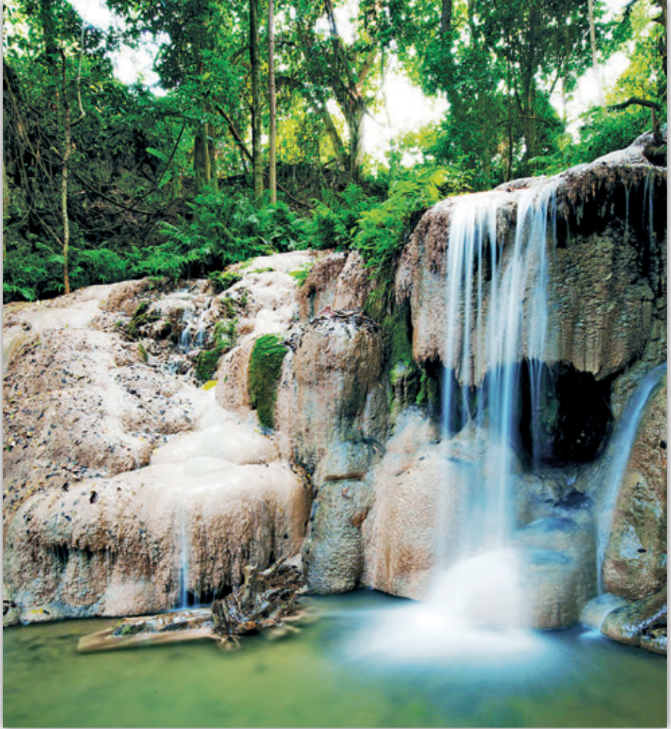
น้ำตกเพ็ญดิน

การเดินทาง ใช้เส้นทางเดียวกับทางไปสวนหินผางาม แต่แยกที่บ้านปวนพุ เลี้ยวขวาไปตามถนนสายปวนพุ- ภูหลวง ประมาณ ๓ กิโลเมตร