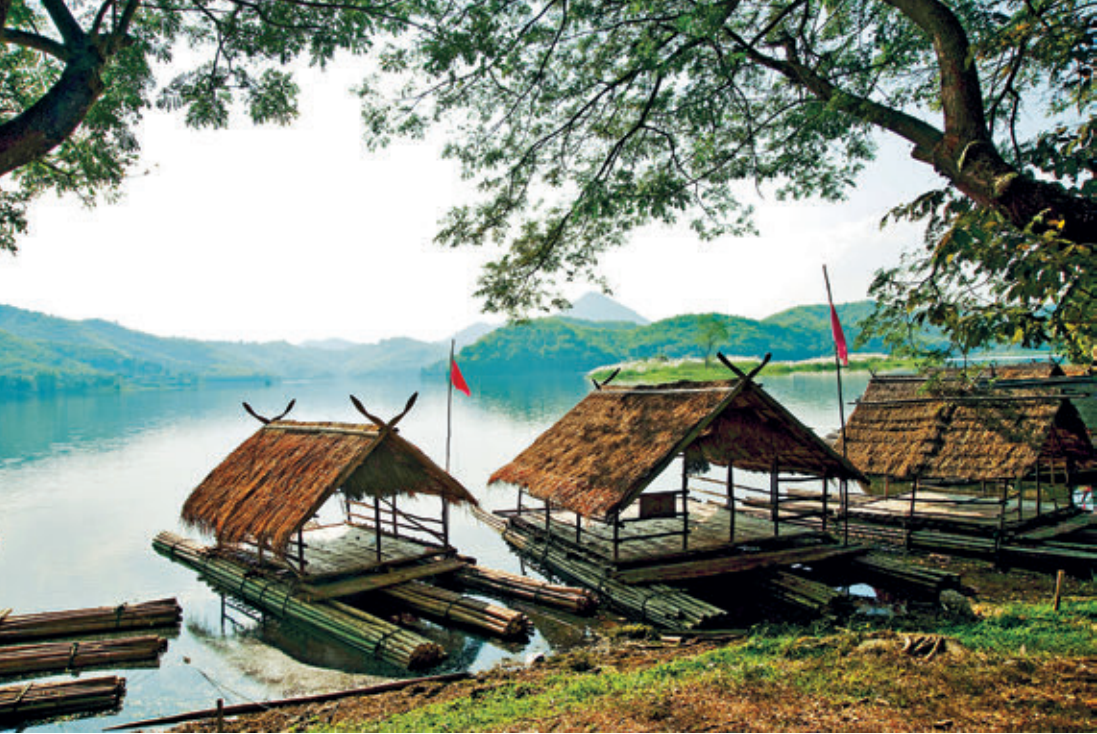
อ่างเก็บน้ำห้วยน้ำหวานตอนบน

แห่งนี้เป็นภูเขาหินปูนสูงชันที่มียอดห้วยกแหลมมากมายตั้งโอบล้อมเสมือนเป็นกำแพง ตรงกลางเป็นผืนป่าดิบ มีพืชสมุนไพร จุดชมวิว และถ้ำต่าง ๆ ได้แก่ ถ้ำแก้ว ถ้ำผาป่อง รวมทั้งบ่อน้ำซับ หรือน้ำผุดเป็นบ่อน้ำศักดิ์สิทธิ์อยู่ใจกลางป่า เชื่อกันว่าเป็นช่องทางของพญานาค ซึ่งเป็นทางน้ำใต้ดินที่ไปทะลุออกแม่น้ำโขงได้ การเดินทางเข้าไปชมจะต้องมีเจ้าหน้าที่นำทางเที่ยวชมด้วย สำหรับนักท่องเที่ยวที่ต้องการพักผ่อน สามารถกางเต็นท์พักผ่อนได้ในบริเวณที่ทำการวนอุทยานฯ นักท่องเที่ยวควรติดต่อล่วงหน้า ๑ เดือน ที่วนอุทยานภูผาล้อม ตู้ ปณ. ๗ ปทจ. เลย จังหวัดเลย ๔๒๐๐๐