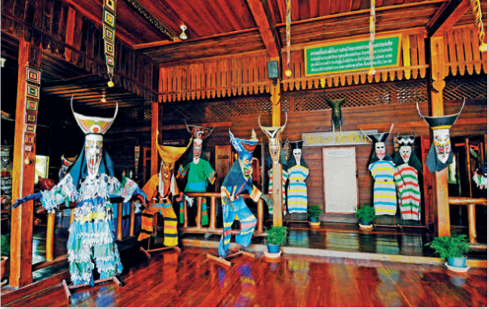
พิพิธภัณฑ์พื้นบ้านผีตาโขน

พิพิธภัณฑ์พื้นบ้านผีตาโขน ตั้งอยู่ภายในบริเวณ วัดโพนชัย ห่างจากอำเภอเมืองฯ ๘๒ กิโลเมตร เป็นแหล่งท่องเที่ยวเพื่อการศึกษาสำหรับผู้สนใจเกี่ยวกับงานประเพณีบุญหลวงและการละเล่นผีตาโขน อาคารพิพิธภัณฑ์เป็นเรือนไม้ จัดแสดงเกี่ยวกับประวัติศาสตร์ความเป็นมาของเมืองด่านซ้าย นิทรรศการผีตาโขน การสาธิตการทำหน้ากากผีตาโขน และจำหน่ายสินค้าที่ระลึกผีตาโขนในรูปแบบต่าง ๆ เปิดให้ชมทุกวัน เวลา ๐๙.๐๐-๑๗.๐๐ น. นอกจากนี้ยังมีอุโบสถ ซึ่งเป็นฝีมือของช่างท้องถิ่น และพระธาตุศรีสองรักจำลอง ซึ่งเป็นสถานที่จัดงานบุญพระเวสและงานบุญต่าง ๆ รวมทั้งการจัดงานประเพณีบุญหลวงและการละเล่นผีตาโขนอีกด้วย สอบถามข้อมูลได้ที่ศูนย์การศึกษานอกโรงเรียน อำเภอด่านซ้าย โทร. ๐ ๔๒๘๙ ๑๐๙๔