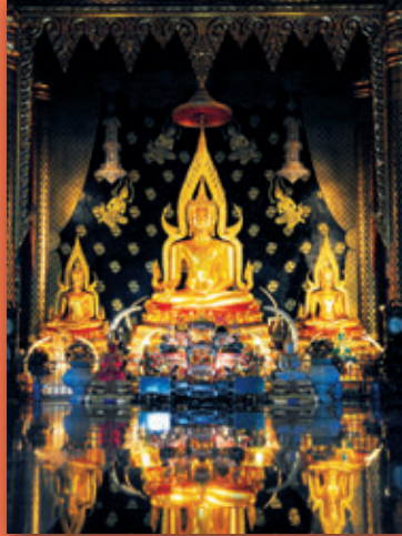
วัดเนรมิตวิปัสสนา