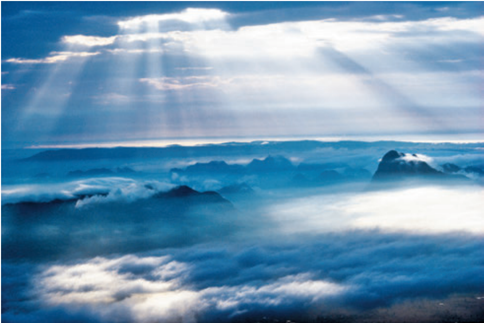
อุทยานแห่งชาติภูกระดึง

เชียงคานแกลลอรี่ ๕๓๐/๓ ตำบลเชียงคาน โทร.