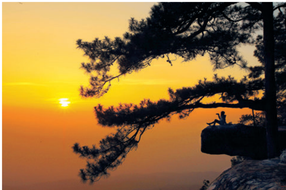
ผาหล่มสัก

ยังจังหวัดเพชรบูรณ์ในสมัยสงครามโลก ครั้งที่ ๒ เพื่อใช้เป็นเส้นทางหลบหลีกนำจอมพล ป. ไปหลบภัย จากทหารญี่ปุ่น ตัวน้ำตกมีความสูง ๔๐ เมตร เมื่อน้ำตกไหลลงมาจากหน้าผาสู่แอ่งน้ำจะมีเสียงดัง กึกก้อง จึงได้ชื่อว่า “น้ำตกตาดฮ้อย” นอกจากนี้ ในเส้นทางยังมีสถานที่ท่องเที่ยว ได้แก่ ตาดห้วยวัว หาดทรายขาว แก่งหินตั้ง ภาพเขียนสีก่อนประวัติศาสตร์ และจุดชมวิวกุลาตม่วง เป็นจุดที่นักท่องเที่ยว สามารถชมวิวทิวทัศน์ได้