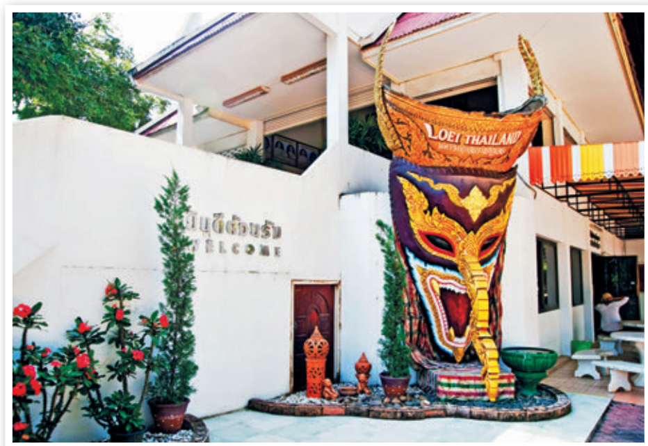
ศูนย์วัฒนธรรมจังหวัดเลย

ศูนย์วัฒนธรรมจังหวัดเลย ตั้งอยู่ในมหาวิทยาลัยราชภัฏเลย เป็นอาคาร ๒ ชั้น รวบรวมและเผยแพร่เรื่องราวทางด้านศาสนา ประเพณี และวิถีชีวิตของชาวเลยในหลาย ๆ ด้าน ภายในตัวอาคาร ศูนย์วัฒนธรรมมีการจัดแสดงแบ่งเป็น ๓ ส่วน คือ ส่วนแรก ห้องประชุมและฉายสไลด์เกี่ยวกับเมืองเลย และแสดงข้าวของเครื่องใช้ที่เกี่ยวข้องกับวิถีชีวิตของคนในอดีต ส่วนที่สอง ห้องนิทรรศการชั่วคราว จัดแสดงเกี่ยวกับพระพุทธรูปเก่าที่ทำมาจากไม้ หินทราย ดินเผา และเงิน หน้ากากผีตาโขน ข้าวของเครื่องใช้โบราณ ซึ่งของทั้งหมดได้มาจากชาวบ้านในท้องถิ่นเมืองเลย นอกจากนี้ยังมี ส่วนนิทรรศการหมุนเวียนทุก ๓ เดือน โดยจัดแสดงเรื่องราวต่าง ๆ ของเมืองเลยตามเทศกาล ประเพณี ส่วนที่สาม มีห้อง “เป็งไทเลย” เป็น