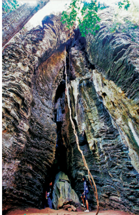
ถ้ำโพธิสัตว์

วังรีสอร์ท สาขา ๑ ๑๓๖ หมู่ ๑๑ ถนนศรีสงคราม ตำบลศรีสงคราม โทร. ๐ ๔๒๘๘ ๒๒๗๐-๒ www.wangresort.com จำนวน ๖ ห้อง ราคา ๓๕๐ บาท สาขา ๒ จำนวน ๒๕ ห้อง และบ้าน ๒ หลัง ราคา ๓๕๐-๒,๐๐๐ บาท