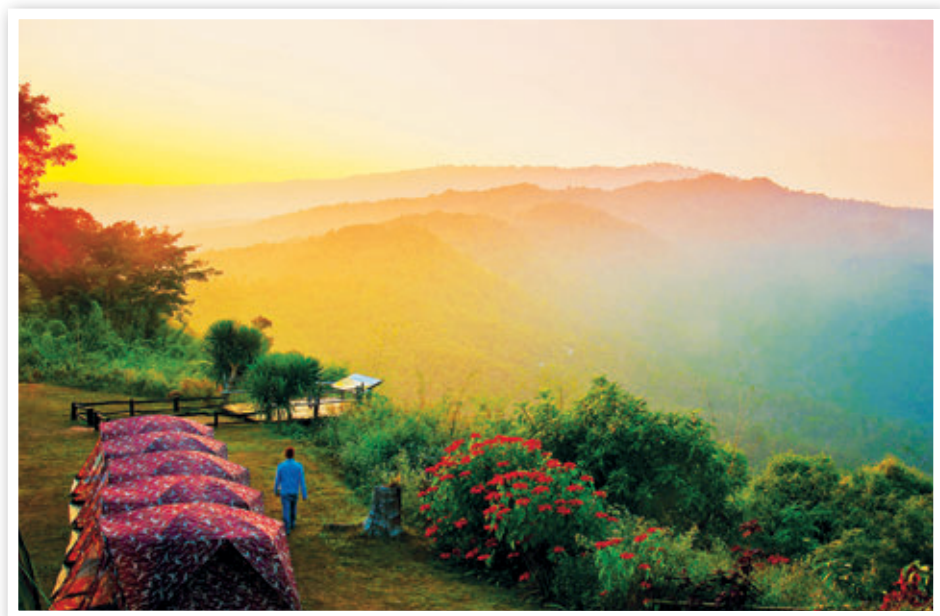
อุทยานแห่งชาติภูสวนทราย

ภาพเขียนดังกล่าวเขียนขึ้นเมื่อจุลศักราช ๑๒๑๔ ตรงกับ พ.ศ. ๒๓๙๕ ตรงกับช่วงรัชกาลพระบาทสมเด็จพระจอมเกล้าเจ้าอยู่หัว และที่ด้านนอกพระอุโบสถหลังเดียวกันนี้ยังมีภาพจิตรกรรม ซึ่งเขียนขึ้นในสมัยหลัง คือเมื่อปี พ.ศ. ๒๔๕๙ นับเป็นโบราณสถานและโบราณวัตถุที่มีค่ายิ่งแห่งหนึ่งของจังหวัดเลย และกรมศิลปากรประกาศขึ้นทะเบียนวัดโพธิ์ชัยเป็นโบราณสถานสำคัญของชาติ เมื่อวันที่ ๑ กุมภาพันธ์ ๒๕๓๐