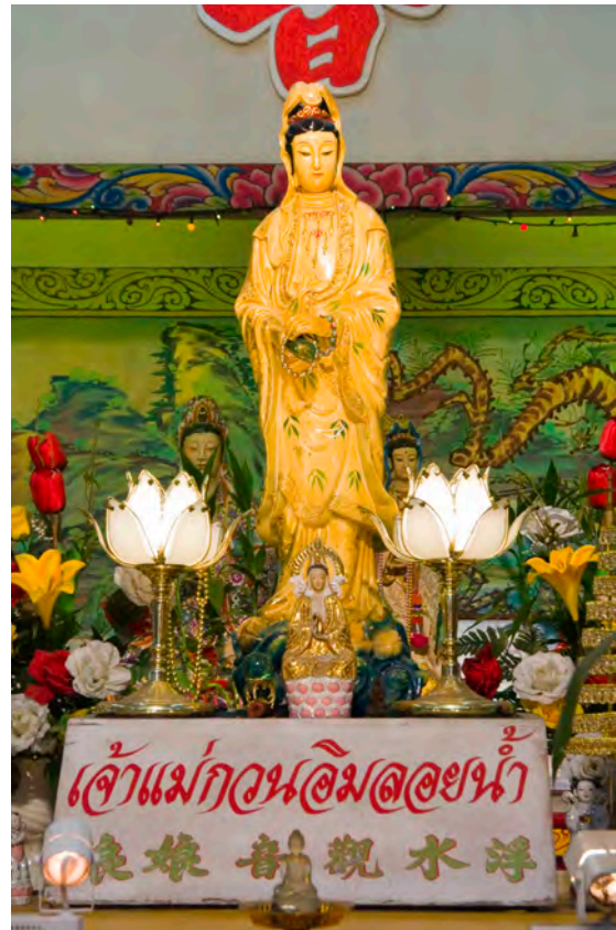
เจ้าแม่กวนอิมลอยน้ำ

ตลาดบ้านใหม่ ตลาดริมน้ำร้อยปี อยู่ถนนศุภกิจ (ทางไปอำเภอบางน้ำเปรี้ยว) เป็นตลาดโบราณริมฝั่งแม่น้ำบางปะกงอายุกว่า ๑๐๐ ปี ที่สะท้อนให้เห็นวิถีชีวิตผู้คนกับชุมชนที่อยู่ริมแม่น้ำมาเก่าแก่ตั้งแต่ก่อนสมัยรัชกาลที่ ๕ และเพื่อเป็นการอนุรักษ์วิถีชีวิตแบบนี้เอาไว้และสร้างอาชีพให้ชาวชุมชน จึงเกิด “ชมรมรักษตลาดบ้านใหม่” ในตลาดจะมีสินค้าต่างๆ จำหน่ายทั้งอาหาร ข้าวแกง ก๋วยเตี๋ยวเป็ด กาแฟโบราณ เครื่องดื่มโบราณ สมุนไพร ขนมทั้งไทย จีน ของเล่นโบราณ ของฝากของที่ระลึกต่างๆ เปิดในวัน