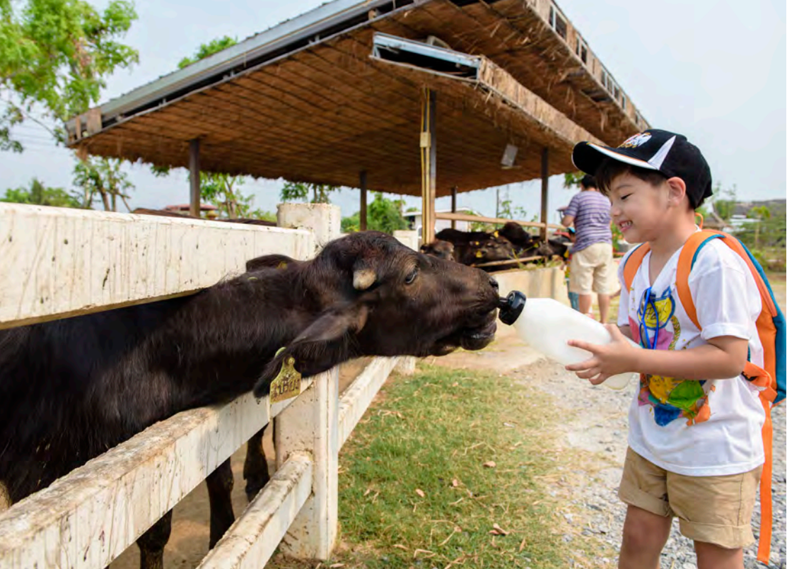
มินิมูร่าห์ฟาร์ม

นอกจากนั้นยังมี น้ำตกอ่างฤาไน หรือ น้ำตกบ่อทอง อยู่ที่หน่วยพิทักษ์ป่า น้ำตกบ่อทอง เกิดจากคลองหมากบนเขาอ่างฤาไน เป็นน้ำตกที่มีน้ำไหลตลอดปี ห่างจากที่ทำการเขตรักษาพันธุ์สัตว์ป่าเขาอ่างฤาไน ประมาณ ๔๐ กิโลเมตร มีทางเข้าจากบริเวณบ้านหนองคอก เส้นทางต้องใช้รถขับเคลื่อนสี่ล้อ ตัวน้ำตกอยู่ห่างจากหน่วยพิทักษ์ป่า น้ำตกบ่อทอง ประมาณ ๒ กิโลเมตร เป็นเส้นทางเดินป่าศึกษาธรรมชาติ เหมาะสำหรับผู้ที่สนใจเรียนรู้ศึกษาธรรมชาติอย่างแท้จริง และน้ำตกเขาตะกรับ ขึ้นอยู่กับหน่วยพิทักษ์ป่าเขาตะกรับ เลียดจากที่ทำการเขตรักษาพันธุ์สัตว์ป่าเขาอ่างฤาไน ประมาณ ๓๐ กิโลเมตร