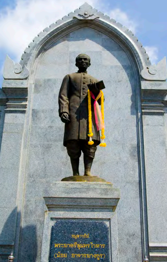
อนุสาวรีย์พระยาศรีสุนทรโวหาร (น้อย อาจารยางกูร)

พระอุโบสถหลังใหม่ โดยได้อัญเชิญพระพุทธรูปโสธรองค์จำลองไปประดิษฐานไว้เพื่อเปิดให้ประชาชนได้นมัสการตามปกติ เปิดให้นมัสการวันธรรมดาเวลา ๐๗.๐๐ - ๑๖.๓๐ น. วันเสาร์-อาทิตย์เวลา ๐๗.๐๐ - ๑๗.๐๐ น.