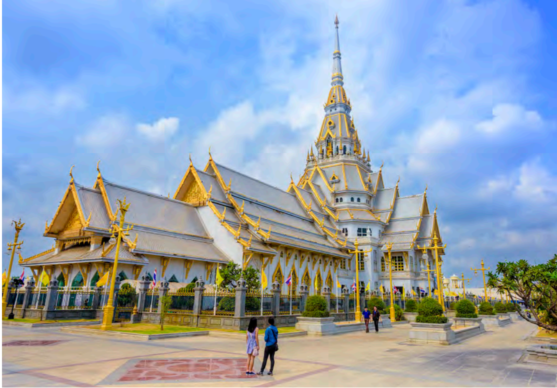
วัดโสธรวรารามวรวิหาร

ผู้มา ลักไปจึงได้เอาปูนพอกเสริมหุ้มองค์เดิมไว้จนมีลักษณะดังที่เห็นในปัจจุบัน ทุกวันนี้จะมีผู้คนต่างมานมัสการปิดทองหลวงพ่อโสธรกันเป็นจำนวนมาก