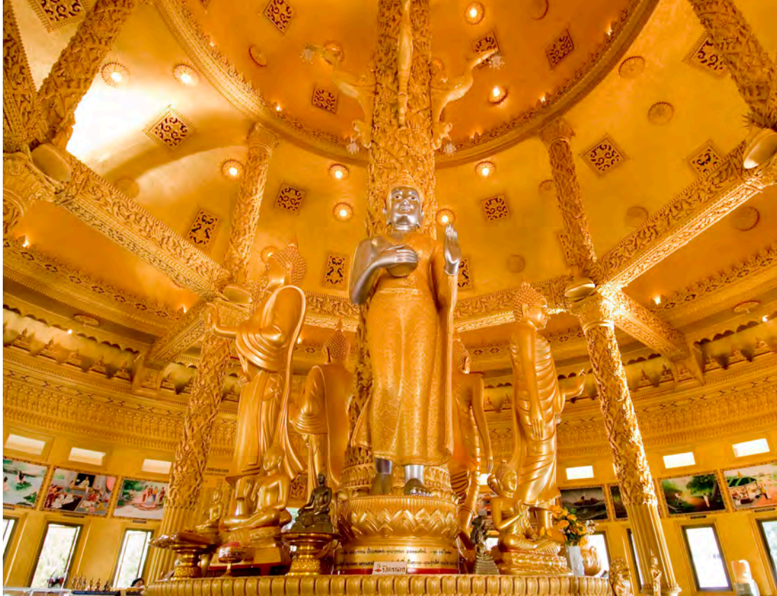
วัดพระธาตุวาโย

ของพื้นที่ป่าผืนใหญ่รอยต่อ ๕ จังหวัด คือ ฉะเชิงเทรา ชลบุรี ระยอง จันทบุรี และสระแก้ว เป็นป่าลุ่มต่ำที่ไม่ผลัดใบที่อยู่ใกล้กรุงเทพมหานครมากที่สุด ป่าดงดิบส่วนใหญ่เป็นป่าดงดิบแล้ง มีเพียงเล็กน้อยที่เป็นป่าดงดิบชื้น ป่าเบญจพรรณ ป่าเต็งรังและทุ่งหญ้า เป็นผืนป่าอุดมสมบูรณ์ผืนสุดท้ายของภาคตะวันออก มีความหลากหลายทางชีวภาพอย่างมาก เป็นแหล่งต้นน้ำลำธารของแม่น้ำบางปะกงทางด้านจังหวัดฉะเชิงเทรา คลองตะโหนดจังหวัดจันทบุรี และแม่น้ำประแสร์ในจังหวัดระยอง สภาพภูมิประเทศทั่วไปมีความลาดชันไม่มากนัก มีความสูงจากระดับน้ำทะเลปานกลางประมาณ ๓๐-๘๐๒ เมตร ยอดเขาสูงสุดอยู่ทางทิศตะวันออกเฉียงใต้ของเขตรักษาพันธุ์ฯ คือ เขาสิบห้าชั้น มีความสูงจากระดับน้ำทะเลปานกลาง ๘๐๒ เมตร