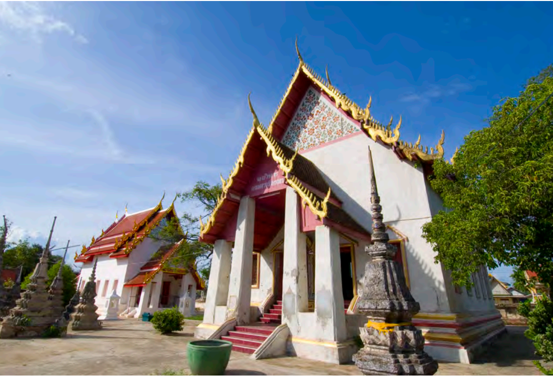
วัดเมือง

สวนสมเด็จพระศรีนครินทร์ฉะเชิงเทรา อยู่หน้าศาลากลางจังหวัด บนเนื้อที่ประมาณ ๙๐ ไร่ เป็นสวนสาธารณะที่มีสระน้ำขนาดใหญ่อยู่กลางสวน มีทางเดินโดยรอบสระและต้นไม้ขึ้นร่มรื่น เหมาะเป็นสถานที่พักผ่อนหย่อนใจ