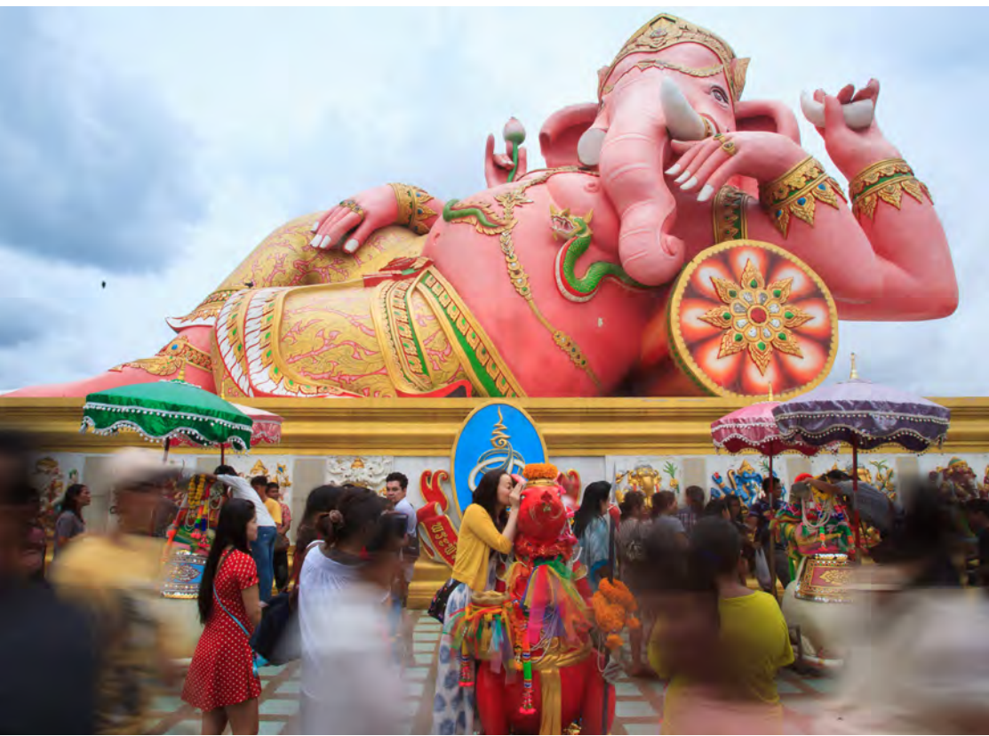
วัดสมานรัตนาราม

สังเกตป้าย วิ่งข้ามสะพานสูงซึ่งเป็นเชือกทนต์น้ำ ลงสะพานประมาณ ๑ กิโลเมตร จะถึงปากทางเข้า วัดสมานรัตนาราม และจากสถานีขนส่งผู้โดยสาร จังหวัดฉะเชิงเทรา มีรถสองแถววิ่งบริการผ่านสถานี รถไฟไปยังวัด