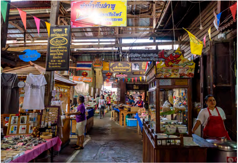
ตลาดบ้านใหม่

ท้องมังกร ส่วนตำแหน่งหัวมังกรอยู่ที่วัดเล่งเน่ยยี่ จังหวัดกรุงเทพฯ และหางมังกรนั้นอยู่ที่วัดเล่งฮกยี่ จังหวัดจันทบุรี ทั้งสามตำแหน่งของมังกรพาดผ่านดินแดนของความมั่งคั่ง อุดมสมบูรณ์ เยาวราชดินแดนแห่งการค้าขาย เมืองแปดริ้วดินแดนแห่งความอุดมสมบูรณ์ด้วยพืชพันธุ์ธัญญาหารและจังหวัดจันทบุรี เมืองแห่งอัญมณีพลอย ภายในวัดจีนประชาสโมสรมี สิ่งที่น่าสนใจมากมาย เช่น ทำว้จตุโลกบาลขนาดใหญ่ ๔ องค์ทำจากกระดาศที่ประตูทางเข้า พระประธาน ๓ องค์ และองค์ ๑๘ อรหันต์ ทำด้วยกระดาศนำมา จากเมืองจีน รูปหล่อเทพเจ้าแห่งโชคลาก(ไฉ่เซ่งเอี้ย) ที่อยู่ด้านขวาขององค์พระประธานและยังมีเทพเจ้า อีกหลายองค์ตามคติจีน ระฆังใบใหญ่น้ำหนักกว่า ๑ ตัน ซึ่งเป็น ๑ ใน ๓ ใบในโลกที่รอประขังมีอักษรมหาปรัชญาปารมิตราสูตรถึอกันว่าผู้ใดได้ตรึงขังก็เหมือน