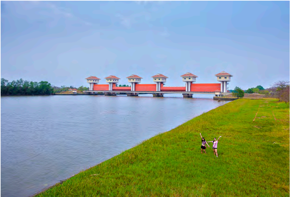
เขื่อนทดน้ำบางปะกง

ประดิษฐานพระพุทธรูปปางต่างๆ เปิดให้นักท่องเที่ยวเข้าชมทุกวัน