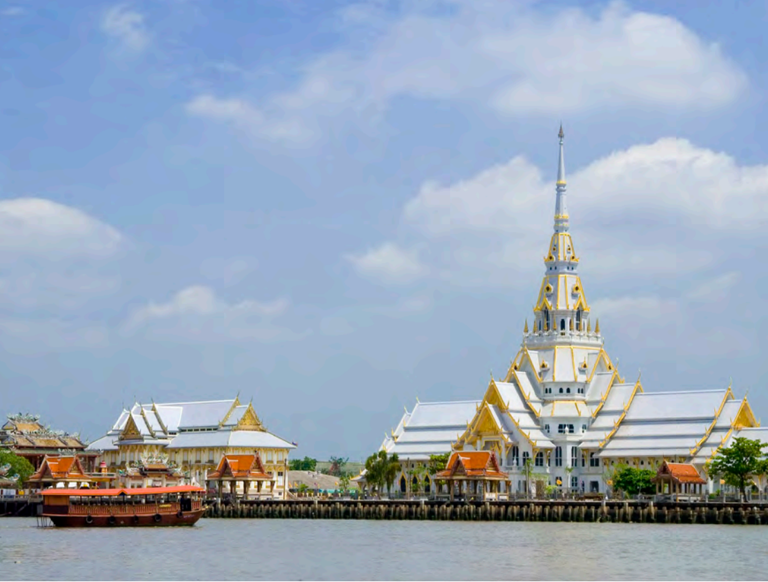
ล่องเรือชมลำน้ำบางปะกง

ตั้งตระหง่านบนยอดเขา มีจุดชมวิวทิวทัศน์ได้ในมุมกว้าง นอกจากนี้ยังมีมณฑปเก่าแก่ที่ได้รับการบูรณะแล้ว สันนิษฐานว่าเป็นอนุสรณ์สถานที่พักกองทัพของสมเด็จพระเจ้าตากสินมหาราช รวมไปถึงถ้ำโบราณที่ชาวบ้านเชื่อว่าเป็นถ้ำศักดิ์สิทธิ์ ติดต่อบริเวณ โทร. ๐๘ ๑๘๖๑ ๙๖๑๑