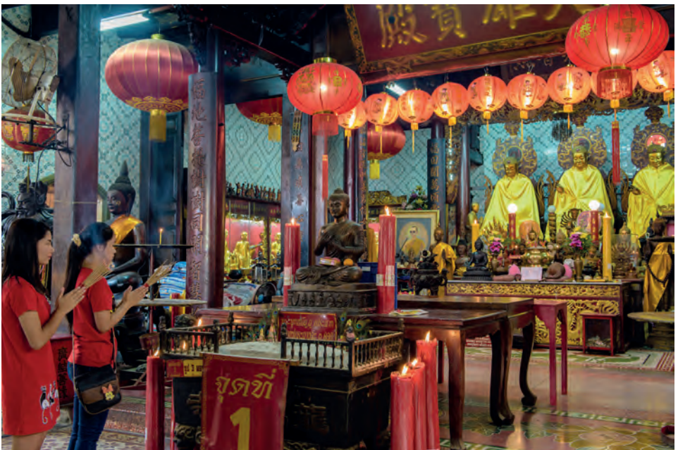
วัดจีนประชาสโมสร

ชมทัศนียภาพของริมน้ำบางปะกง ตึกเก่าบนถนน พานิชยานตลาดทรัพย์สินส่วนพระมหากษัตริย์ และ อาคารสำนักงานทรัพย์สินส่วนพระมหากษัตริย์ ซึ่ง เคยเป็นอาคารที่ว่าการมณฑลปราจีนในอดีต มุ่งหน้า ไปบนถนนศุภกิจ หรือถนนบางน้ำเปรี้ยว - ฉะเชิงเทรา แวะไหว้เจ้าแม่กวนอิมลอยน้ำ ณ สมาคมสงเคราะห์ การกุศลฉะเชิงเทรา จากนั้นเข้าวัดอภัยภูฏาติการาม วัดพุทธมหายานแบบญวน นมัสการพระพุทธไตรรัตน นายก เดินชมรูปปั้นเทพเจ้าตามคติจีน ขับรถต่อไป อีกไม่กี่กิโลก็ถึง วัดเล่งฮกยี่ หรือ วัดจีนประชาสโมสร นมัสการพระประธาน ๓ องค์ ที่ทำด้วยกระดาศ ซึ่ง นำมาจากเมืองจีน ถ้าอยากมีโชคลาภ ก็ให้ไปลูบอุ้งเงิน ของเทพเจ้าแห่งโชคลาภ ที่อยู่ด้านขวาขององค์พระ ประธาน แล้วแวะทานอาหารกลางวันที่ร้านสามแม่ คริว (เตาพื้น) ร้านป่าหนู หรือร้านตำเคียงน้ำ เป็นต้น