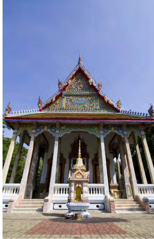
วัดสัมปทวนนอก

วัดสัมปทวนนอก อยู่ถนนศุภกิจ เดิมชื่อวัดสวนพริก (นอก) สร้างขึ้นปลายสมัยกรุงธนบุรี โดยพระภิกษุอิน และชาวบ้าน มีตำนานเกี่ยวกับหลวงพ่พุทธโสธร ที่ลอยทวนน้ำในแม่น้ำบริเวณหน้าวัด มาเป็นชื่อเรียกวัดและสถานที่แห่งนี้ว่า “สามพระทวน” และกลายเป็น “สัมปทวน” ในที่สุด สิ่งที่น่าสนใจคือ พระอุโบสถที่มีลายปูนปั้นอยู่บนชายคากระเบื้องโบลัด