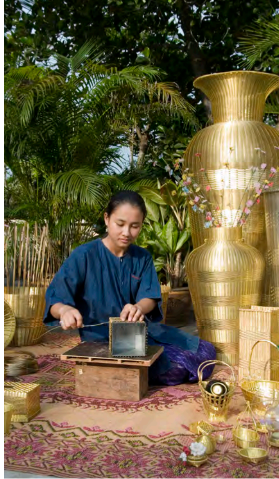
หัตถกรรมสานทองเหลือง บ้านคลองขุดใหม่

ร้านสิริเพ็ญ ๑๘ ถนนแอมอรอุทิศ ๒ ตำบลหน้าเมือง จำหน่ายชิฟพอน เค้ก เบเกอร์รี่ โทร. ๐๘ ๑๘๑๒ ๗๔๙๙ เปิดบริการ ๐๗.๐๐ - ๒๐.๐๐ น.