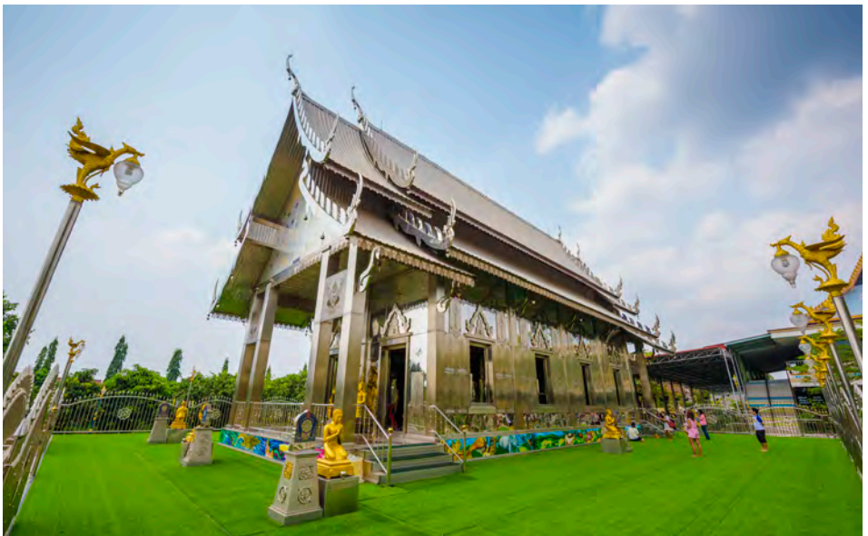
วัดหัวสวน

วัดหัวสวน อยู่หมู่ที่ ๔ ตำบลเสม็ดใต้ วัดนี้มีโบสถ์สวยที่ดูแปลกและสะดุดตาคือใช้เสตมเลสนำมาเป็นวัสดุในการก่อสร้างทั้งหลังไม่ว่าจะเป็นข้อฟ้า ไบระกา และหางหงส์ ด้วยวัตถุประสงค์เพื่อความคงทนถาวร ส่วนภายในโบสถ์มีภาพจิตรกรรมฝาผนังที่บอกเล่าเรื่องราวของทศชาติชาติขาค โดยใช้วิธีการพันแอร์บริช ซึ่งเป็นเทคนิคที่งดงามและแปลกตา สอบถามข้อมูล โทร. ๐๘ ๙๐๙๙ ๐๗๙๓