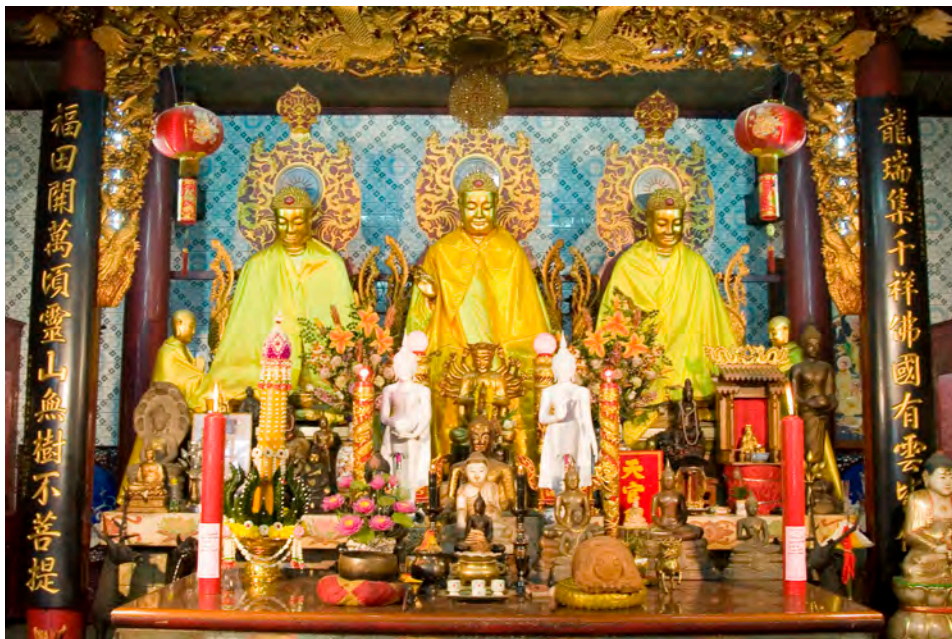
วัดจีนประชาลโสมร

กับการสวดมนต์ซึ่งได้บุญกุศล นอกจากนี้ยังมีวิหารศักดิ์สิทธิ์ต่างๆ เช่น วิหารบูรพาจารย์ วิหารเจ้าแม่กวนอิม วิหารตั้งจิ้งอ้วงและสระนทีสวรรค์ เป็นต้น