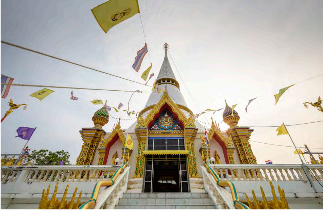
วัดเขาดิน