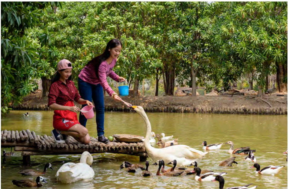
สวนปาล์มฟาร์มมก

เส้นทางท่องเที่ยวเชิงเกษตร นิเวศและวัฒนธรรม ตำบลคลองเขื่อน โดยมีองค์การบริหารส่วนตำบลคลองเขื่อนเป็นผู้ดูแลเส้นทางนี้ เพื่อการเรียนรู้ทั้งเชิงเกษตรนิเวศ และวัฒนธรรมในเขตชุมชนด้วย