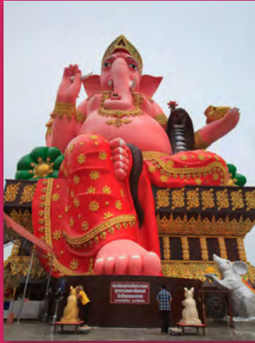
อุทยานพระพิฆเนศ