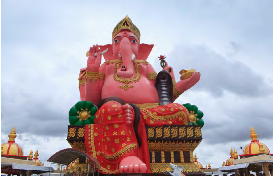
วัดโพรงอากาศ

ยังเป็นที่ประดิษฐานองค์พระพิฆเนศปางนั่งประทานพรขนาดใหญ่ที่สง่างาม เป็นที่เคารพสักการะของผู้เลื่อมใสศรัทธา