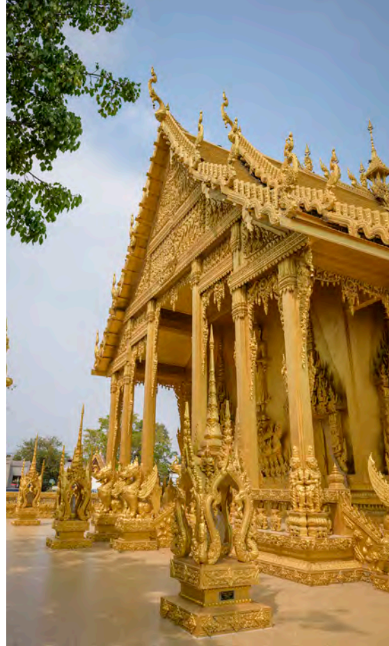
วัดปากน้ำโจ้โล้

วัดปากน้ำโจ้โล้ อยู่ในเทศบาลตำบลปากน้ำ โดดเด่นด้วยโบสถ์ทาสีทองเหลืองอร่ามทั้งหลังที่มีความงดงามทั้งภายในและภายนอก ตามประวัติความเป็นมา วัดนี้ก่อตั้งมาตั้งแต่สมัยอยุธยาตอนปลายสันนิษฐานว่าบริเวณปากน้ำโจ้โล้เป็นที่ตั้งของกองทัพพม่าที่มีการต่อสู้และพ่ายแพ้ให้กับกองทัพของสมเด็จพระเจ้าตากสินมหาราช ภายในวัดมีโบราณวัตถุที่น่าสนใจ อย่างเช่นเรือเกาอายุร้อยกว่าปีที่จัดแสดงไว้บริเวณศาลาการเปรียญ ส่วนบริเวณด้านหลังวัดเป็น