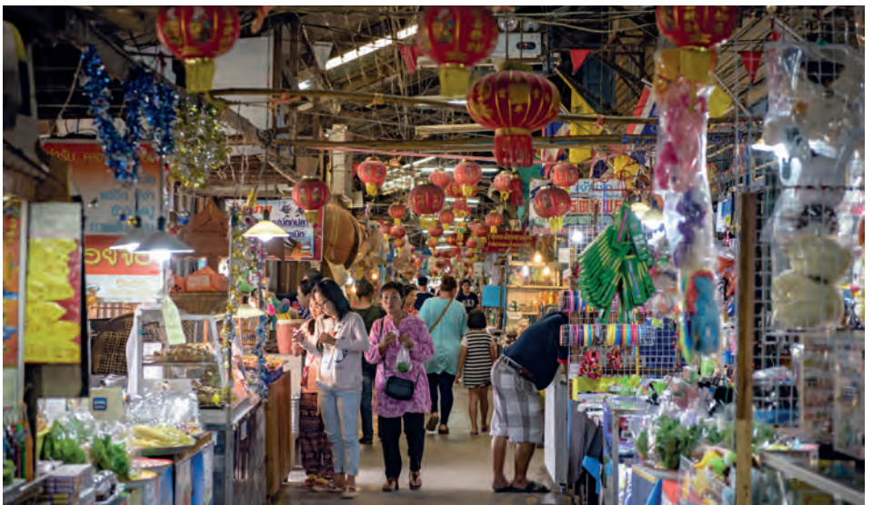
ตลาดคลองสวน ๑๐๐ ปี

รถโดยสารประจำทาง นั่งรถประจำทางสาย ฉะเชิงเทรา-ลาดกระบัง ลงหน้าทางเข้าตลาด แล้วเดินต่อเข้าไปประมาณ ๒๐๐ เมตร