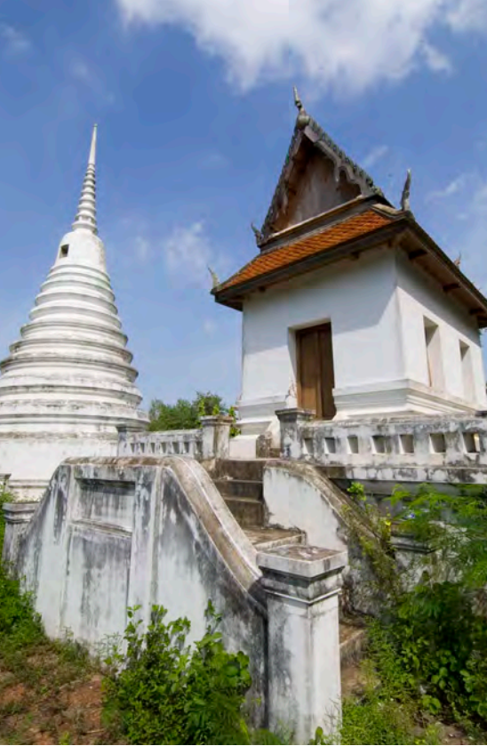
วัดพยัคฆอินทาราม

เจดีย์องค์เล็ก ๒ องค์ วิหารพระพุทธบาท อุโบสถ และหอระฆัง