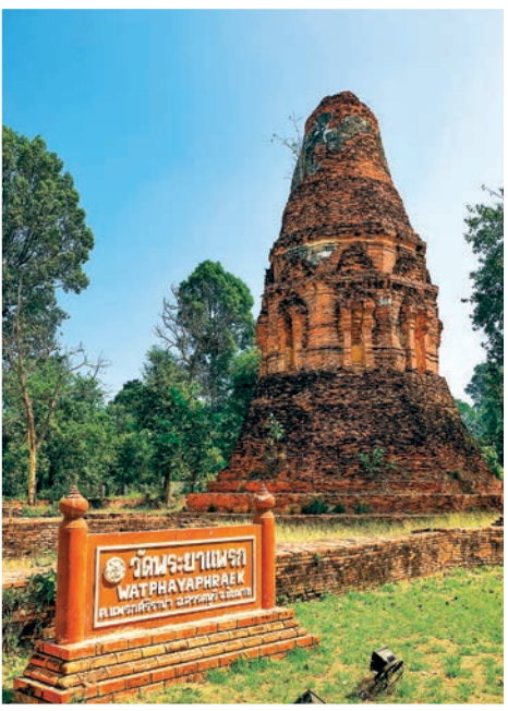
วัดพระยาแพรก

เจดีย์สองพี่น้อง ตั้งอยู่เลยวัดมหาธาตุไป ๓๐๐ เมตร ตามประวัติกล่าวว่า เจ้าอ้าย เจ้าเอี้ย เจ้าสาม เป็นพี่น้องกัน เจ้าอ้ายและเจ้าเอี้ยรบกันเพื่อแย่งราชสมบัติ เจ้าอ้ายและเจ้าเอี้ยเสียชีวิตทั้งคู่ เจ้าสามจึงได้ครองเมือง และได้สร้างปราสาทแก่เจ้าอ้าย สร้างเจดีย์แก่เจ้าเอี้ย สันนิษฐานว่าสร้างก่อนกรุงศรีอยุธยา ๖๐๐ ปี ภายในวัดมีปราสาท ๒ องค์ เป็นปราสาทสมัยลพบุรี องค์ใหญ่ด้านทิศตะวันออกก่อนช้างสมบูรณ มีลายปูนปั้นประดับสวยงาม