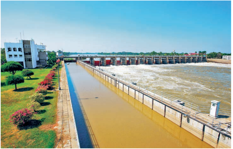
เขื่อนเจ้าพระยา

ยังผลิตไฟฟ้าใช้ภายในจังหวัดด้วย ปัจจุบันยังมีกิจกรรมเสริมเพื่อรองรับนักท่องเที่ยว ดังนี้