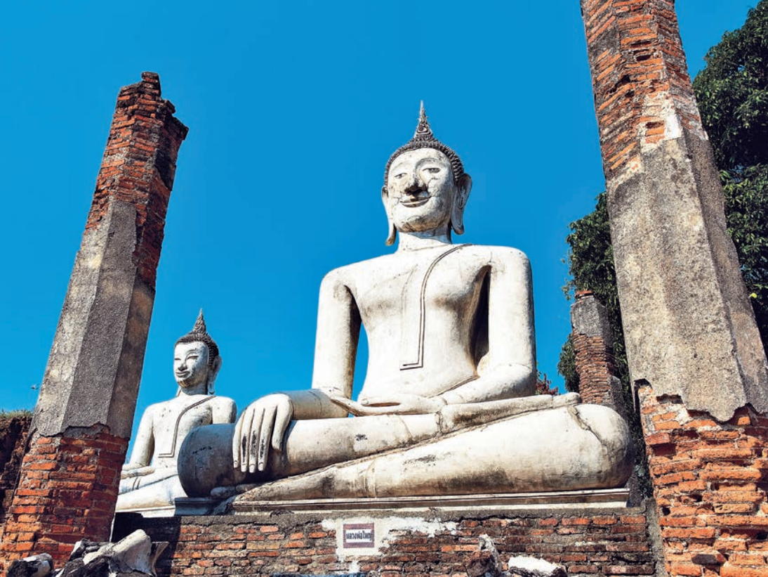
วัดมหาธาตุ

วัดมหาธาตุ เดิมชื่อว่าวัดพระธาตุ หรือวัดหัวเมือง เป็นวัดที่มีความสำคัญทางประวัติศาสตร์คู่เมืองแพรงหรือเมืองสรศักดิ์ ภายในวัดมีโบราณสถานที่น่าสนใจ ดังนี้