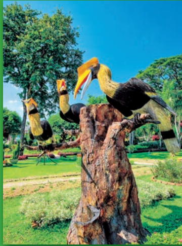
สวนนกจันทนา