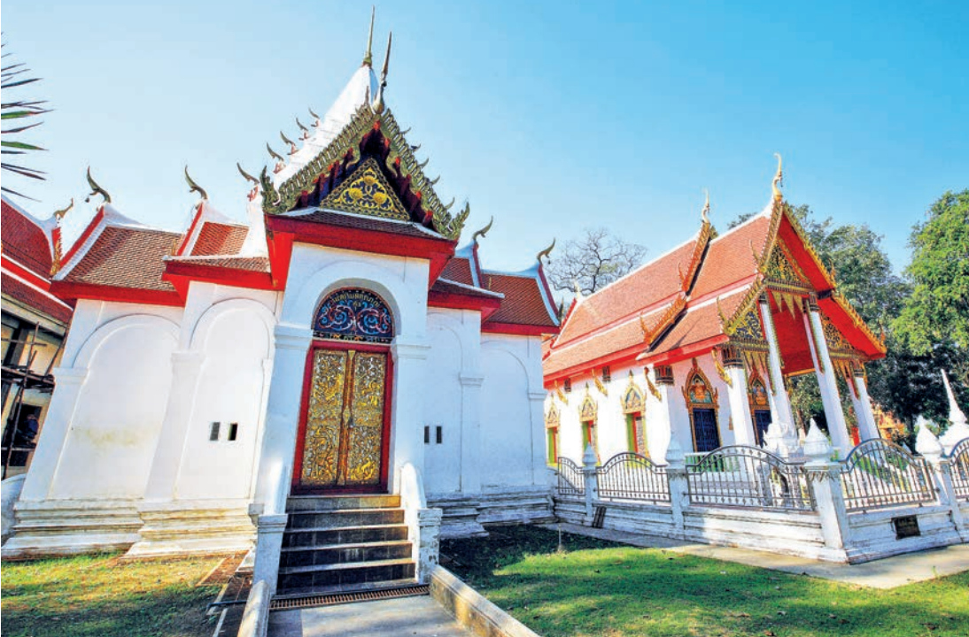
วัดปากคลองมะขามเฒ่า (วัดหลวงปู่ศุข)

ขึ้นเมื่อปี พ.ศ. ๒๔๕๖ แล้วเสร็จเมื่อปี พ.ศ. ๒๔๖๓ อุโบสถสร้างขึ้นเมื่อปี พ.ศ. ๒๔๔๒ ภายในอุโบสถมีภาพจิตรกรรมฝาผนังที่มีคุณค่ายิ่ง โดยเฉพาะภาพเขียนผีพระหัตถ์ของกรมหลวงชุมพรเขตอุดมศักดิ์ พร้อมข้าราชการบริวารร่วมเขียนด้วยตัวอักษรขอม ผนังทางด้านใต้ภาพเขียนระบุปี พ.ศ. ๒๔๓๓ สอบถามข้อมูลได้ที่ โทร. ๐ ๕๖๔๖ ๑๐๑๐