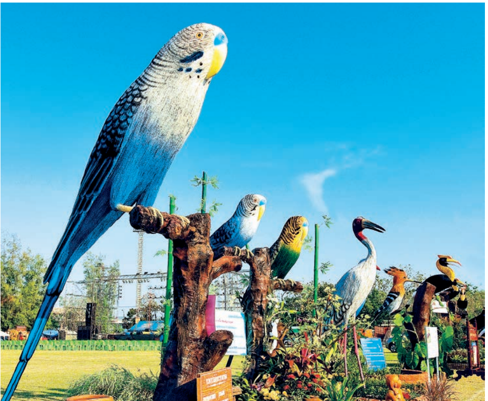
งานมหกรรมหุ่นฟางนกนานาชาติ

งานแข่งเรือยาวประเพณีจังหวัดชัยนาท และงานมหกรรมสินค้าเกษตรของดีเมืองชัยนาท เป็นการนำผลิตภัณฑ์และของดีเมืองชัยนาทมาเผยแพร่ มีการสาธิตในรูปแบบต่างๆ เช่น การทำหุ่นฟางนกเล็ก เครื่องเบญจรงค์ เครื่องปั้นดินเผา ผ้าบาติก ทอผ้าพื้นเมืองด้วยกี่กระตุก ขนมโบราณต่าง ๆ เป็นต้น อีกทั้งผลิตภัณฑ์จากชุมชนในแต่ละอำเภอ ผลิตภัณฑ์ของผู้พิการ/กลุ่มชีวิตใหม่ และสินค้าอีกมากมาย ซึ่งมีการจัดงานประมาณเดือนกรกฎาคมหรือช่วงวันเข้าพรรษา พร้อมกับการแข่งเรือยาวประเพณี ณ บริเวณเขื่อนเรียงหิน ศาลากลางจังหวัดชัยนาท