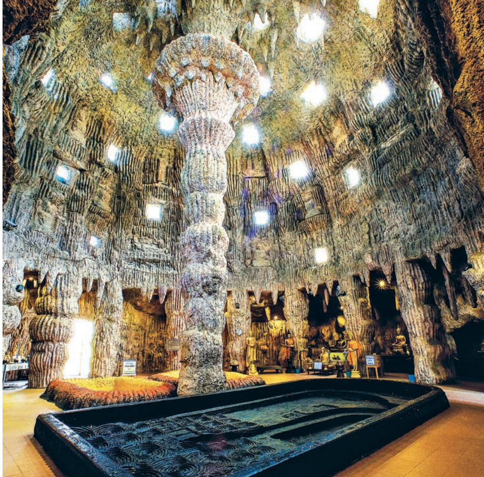
วัดไกลกังวล (เขาสารพัดศรีเจริญธรรม)

วัดไกลกังวล (เขาสารพัดศรีเจริญธรรม) ตั้งอยู่ที่ตำบลบ้านเขื่อน ห่างจากตัวเมือง ๔๘ กิโลเมตร ไปตามทางหลวงหมายเลข ๓๒๑๑ ถึงสี่แยกหันคา เลี้ยวซ้ายไป ๔ กิโลเมตร วัดอยู่ทางขวามือ เลี้ยวขวาเข้าวัดไป ๑.๗ กิโลเมตร จะเห็นรั้วคอนกรีตรอบบริเวณเขตพื้นที่ของวัดยาว ๕,๐๐๐ เมตร วัดไกลกังวลเป็นวัดโบราณสมัยลพบุรี ได้รับการบูรณปฏิสังขรณ์ใหม่เมื่อปี พ.ศ. ๒๕๑๐ บริเวณวัดมีนถุนอง และกวาง บนยอดเขาของวัดยังคงปรากฏซากการสรางโบสถ์ และมีรอยพระพุทธรูปขนาดใหญ หากยืนอยูบนยอดเขาแห่งนี้จะเห็นทัศนียภาพธรรมชาติที่สวยงาม บางครั้ง