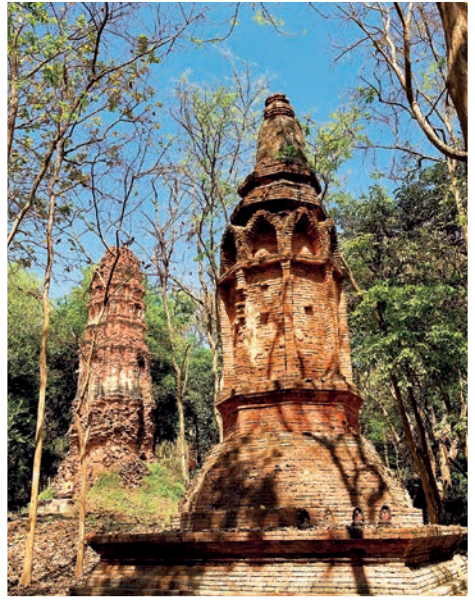
เจดีย์สองพี่น้อง

วัดพระยาแพรก ตั้งอยู่ติดกับวัดมหาธาตุ โบราณสถานที่เหลืออยู่ภายในวัด ได้แก่ เจดีย์ก่ออิฐถือปูนรูปแปดเหลี่ยมทรงสูง สมัยอยุธยาตอนต้น เป็นเจดีย์ที่มีความงดงามมากองค์หนึ่ง