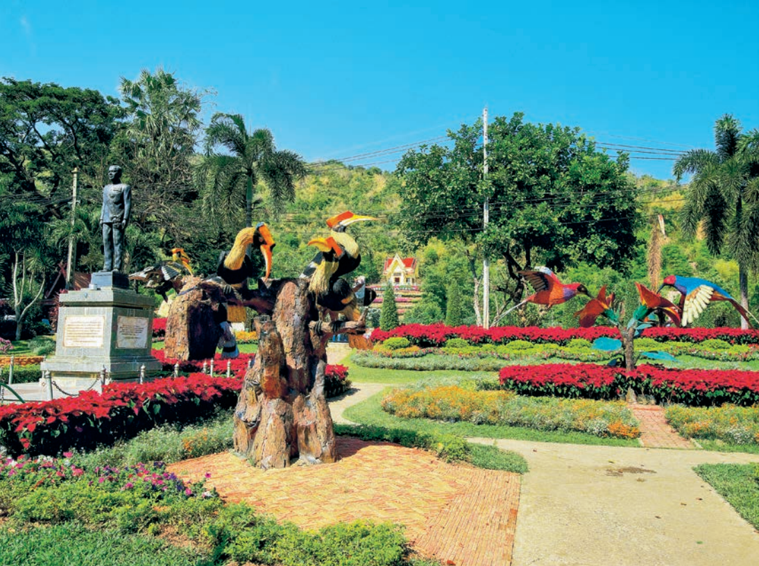
สวนนกชัยนาท

อาคารศูนย์ข้อมูลท่องเที่ยว เป็นแหล่งรวบรวมข้อมูลด้านการท่องเที่ยวจาก ๘ อำเภอของจังหวัดชัยนาท และจัดทำเป็นนิทรรศการ พร้อมนำเสนอผ่านวีดิทัศน์บนเรือจำลองที่มีบรรยากาศสมจริง นักท่องเที่ยวสามารถค้นหาข้อมูลแหล่งท่องเที่ยวได้อย่างครบวงจร