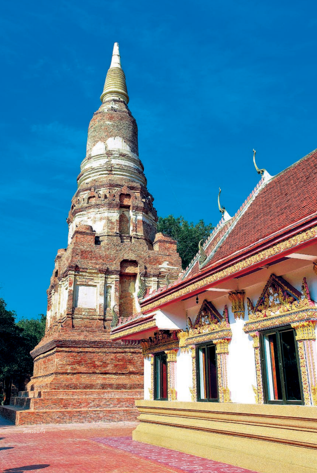
วัดพระแก้ว