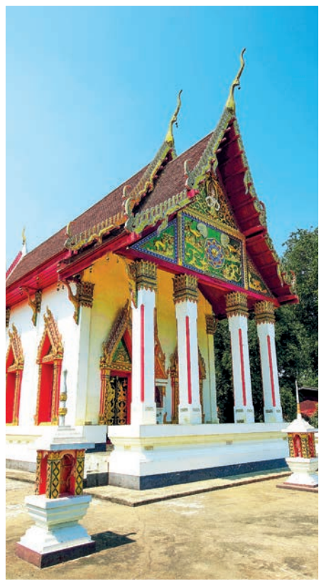
วัดทรงเสวย

นอกจากนั้นยังมีอุโบสถที่สวยงาม กำแพงแก้วมีศิลปะปูนปั้น รูปพุทธประวัติบนซุ้มประตู รูปเหมือนหล่อพระเกจิหลวงพ่อกล้อย อดีตเจ้าอาวาส ที่เป็นลูกศิษย์ผู้แกะแม่พิมพ์พระเครื่องให้หลวงปู่ศุข หลวงพ่อย้อย อดีตเจ้าอาวาสผู้เปี่ยมไปด้วยเมตตาธรรม มีการจัดงานประจำปี ให้ว้พระปิดทอง เนื่องในวันมรณภาพของหลวงพ่อย้อย ในวันที่ ๖ ธันวาคม