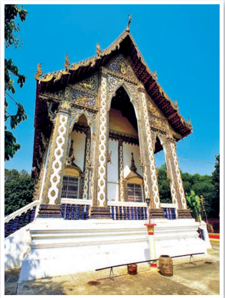
วัดสิงห์สถิต

ในปี พ.ศ. ๒๓๘๖ ชาวบ้านเรียกวัดสิงห์ แต่เดิมบริเวณนี้เคยเป็นป่า คงเป็นที่อยู่อาศัยของสัตว์ร้าย เช่น เสือ เมื่อมีหมู่บ้านขึ้นมา เรียก “บ้านสิง” เมื่อสร้างวัดจึงเรียกว่า “วัดสิงห์” และต่อมาได้เปลี่ยนใช้ชื่อ “วัดสิงห์สถิต” สิ่งสำคัญของวัดนี้ ได้แก่ อุโบสถ เป็นอุโบสถแบบโบราณ ที่เรียกกันว่า “โบสถ์มหาอุด” มีกำแพงแก้วโดยรอบ หน้าบันอุโบสถมีภาพปูนปั้นรูปพระอาทิตย์ทรงกลดที่งดงามมาก นับเป็น