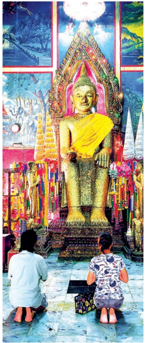
วัดพิชัยนาวาส (วัดบ้านเขียน)

วัดพิชัยนาวาส (วัดบ้านเขียน) ตั้งอยู่ที่ตำบลบ้าน เขียน ห่างจากตัวเมือง ๓๘ กิโลเมตร ตามทางหลวง หมายเลข ๓๒๑๑ กิโลเมตรที่ ๒-๓ เป็นวัดโบราณ สันนิษฐานว่าสร้างในสมัยอยุธยาตอนกลาง มีอายุไม่ ต่ำกว่า ๓๐๐ ปี ภายในพระอุโบสถซึ่งสร้างไว้กลาง สระน้ำ มีพระประธานคือ “หลวงพ่อด” เป็น พระพุทธรูปปางป่าเลไลยก์ ปั้นด้วยปูนสอ ประทับ นั่งห้อยพระบาท สูง ๔ เมตร ๕๔ เซนติเมตร สันนิษฐานว่าในระหว่างการสร้างพระประธานองค์นี้ บ้านเมืองเกิดระส่ำระสายจากสงคราม เพราะเป็น พื้นที่ซึ่งกองทัพเดินทางผ่าน วัดกำหนดจัดงาน นมัสการปิดทองสมโภชในช่วงเทศกาลมาฆบูชาและ เทศกาลลอยกระทงเป็นประจำทุกปี