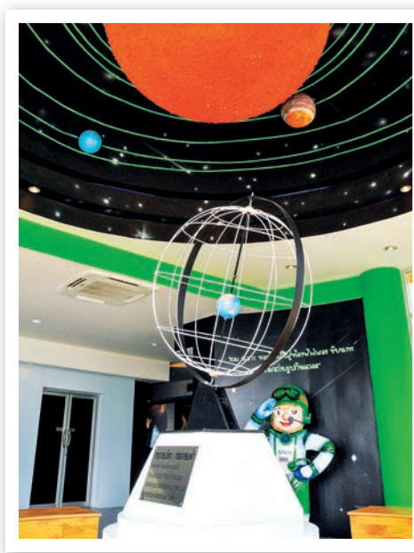
ศูนย์วิทยาศาสตร์ท้องฟ้าจำลอง

ศูนย์วิทยาศาสตร์ท้องฟ้าจำลอง สร้างขึ้นเพื่อพัฒนา ด้านการศึกษา เป็นการเปิดประตูสู่โลกแห่งการเรียนรู้เชิงวิทยาศาสตร์ ดาราศาสตร์ ภูมิศาสตร์ และเพื่อรองรับการท่องเที่ยว โดยได้รับพระบรมราชานุญาต