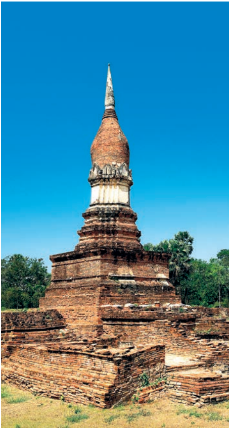
วัดโดนดหลาย

ทำเป็นกระพุ่มกลุ่ม มีลักษณะคล้ายดอกบัวหลวง ส่วนล่างรอบกระพุ่มมีรูปกลีบขนุนของปรางค์ประดับ อยู่ด้านหน้าของเจดีย์ ทางด้านทิศตะวันออกมีแนวฐานวิหารยื่นยาวออกไป พบรอยพระพุทธรูปขนาดใหญ่ทำด้วยปูนปั้น ทางทิศใต้ของวิหารมีเจดีย์ก่อด้วย อิฐเรียงรายอยู่หลายแห่ง