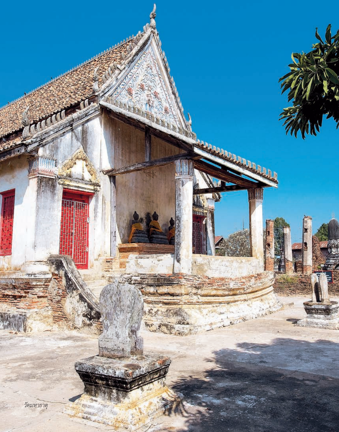
วัดมหาธาตุ