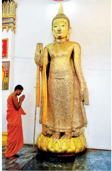
หลวงพ่อธรรมจักร (วัดธรรมามูลวรวิหาร)

หลวงพ่อธรรมจักร เป็นศิลปะประยุกต์ของช่างสมัยเชียงแสนตอนปลายถึงสุโขทัยตอนต้นผสมกับสมัยอยุธยา เป็นพระพุทธรูปปางห้ามญาติประทับยืน