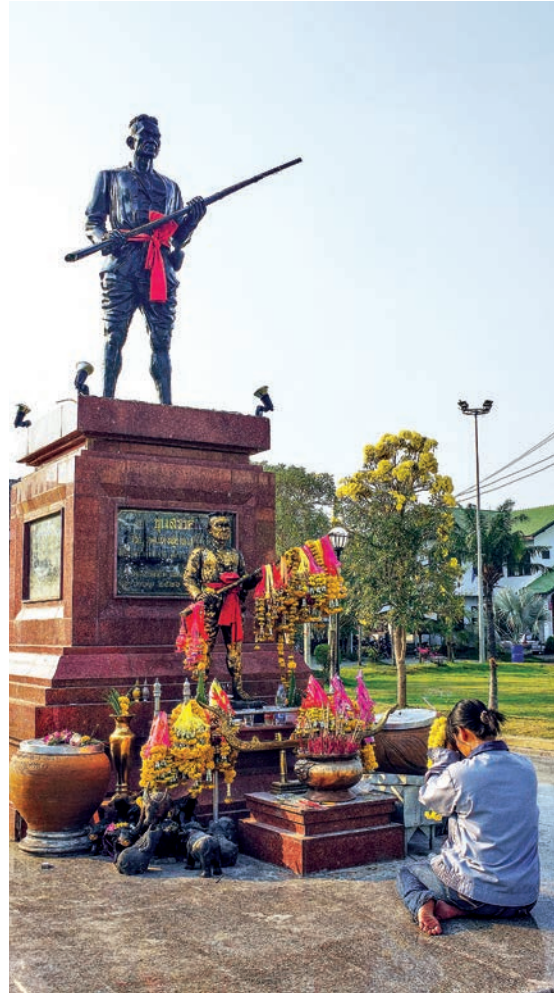
อนุสาวรีย์ขุนสรรค์

เมืองสรรคบุรี หรือเมืองแพรก อยู่ในเขตตำบลแพรกศรีราชา เป็นเมืองโบราณสมัยทวารวดี พระบาทสมเด็จพระมงกุฎเกล้าเจ้าอยู่หัวทรงสันนิษฐานว่าเดิมชื่อเมืองตรัยตรีงส์ เป็นศิลปกรรมแบบอู่ทอง น่าจะสร้างก่อนเมืองชัยนาท และยังคงเป็นเมืองหน้าด่านของกรุงสุโขทัยคู่กันมากับเมืองชัยนาท ในศิลาจารึกของพ่อขุนรามคำแหงมหาราช เรียกเมืองสรรคบุรีว่าเมืองแพรก และเรียกเมืองชัยนาทว่าเมืองชัยนาทบุรี ในปี พ.ศ. ๑๙๑๔ ในรัชสมัยพระมหาธรรมราชาที่ ๑ (พระยาสิทธิ) กรุงศรีอยุธยาได้ยกกองทัพมายึดไว้ ทั้งสองเมืองนี้จึงตกอยู่ในราชอาณาจักรกรุงศรีอยุธยา และได้เปลี่ยนชื่อเมืองแพรกเป็นเมืองสรรคตั้งแต่นั้นมา โดยมีฐานะเป็นเมืองลูกหลวงคู่กับเมืองชัยนาท ผังของเมืองสรรคเป็นผังที่ซับซ้อน แสดงถึงความเป็นเมืองใหญ่ที่อยู่ต่อเนื่องมาช้านาน บริเวณเมืองแบ่งออกเป็นสองตอน ตอนที่อยู่ด้านเหนือเป็นรูปสี่เหลี่ยมกว้างยาวด้านละ ๑,๔๐๐ เมตร ด้านนี้จะเป็นเมืองแพรกเดิม ส่วนทางด้านใต้เป็นรูปสี่เหลี่ยมผืนผ้ากว้าง ๘๐๐ เมตร ยาว ๒,๒๐๐ เมตร เป็นที่ตั้งของ