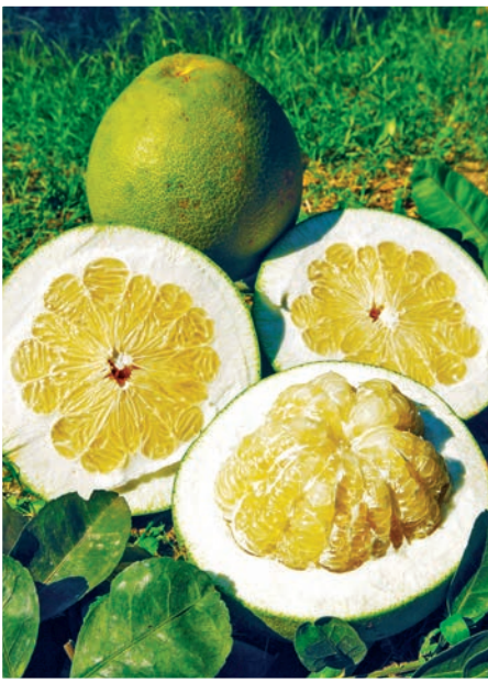
งานส้มโอชัยนาท

งานจักรยานชิงแชมป์ประเทศไทย เป็นการแข่งขันจักรยานชิงถ้วยพระราชทาน ในงานประกอบด้วยการแข่งขันประเภทถนน ชิงถ้วยพระราชทาน “คิงส์คัพ” ประเภทเสือภูเขา ชิงถ้วยพระราชทานสมเด็จพระบรมโอรสาธิราชฯ สยามมกุฎราชกุมาร และการขี่จักรยานเพื่อสุขภาพเฉลิมพระเกียรติ